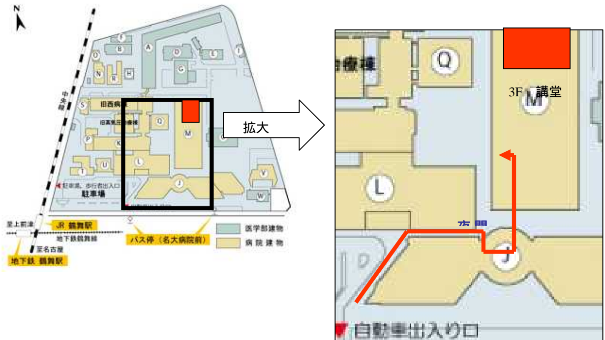
鶴舞キャンパスマップ

M：中央診療棟「M」に入りエレベーターを通過し、しばらく行くと左手奥にエレベーターが3基ありますので、そちらで3階へ上がり矢印に沿ってお進み下さい。